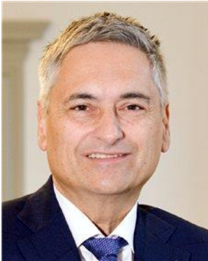
GUIDO GRAF Regierungsrat Kanton Luzern, Vorsteher Gesundheits- und Sozialdepartement