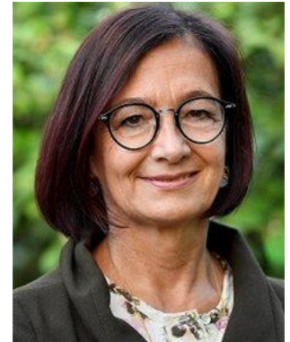
YVONNE GILLI Präsidentin der FMH