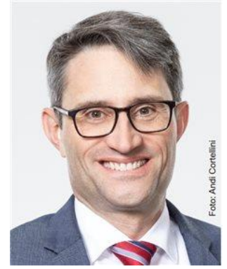
LUKAS ENGELBERGER Regierungsrat Kanton BS, Vorsteher Gesundheitsdepartement und Präsident GDK